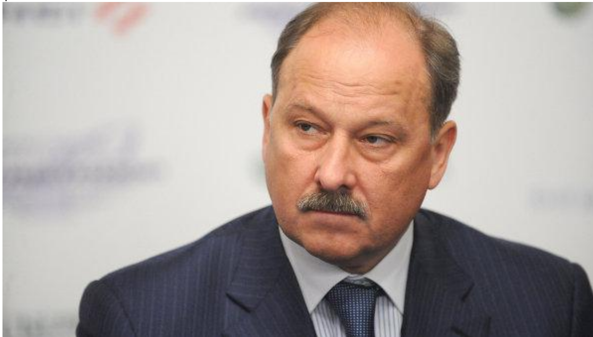
Председатель Госкорпорации Внешэкономбанк Владимир Дмитриев. Архивное фото

По словам главы ВЭБа, такой низкий уровень возврата кредитов вызван катастрофической ситуацией в экономике и высоким уровнем неплатежей. "Это, естественно, повышенные риски", - добавил он.