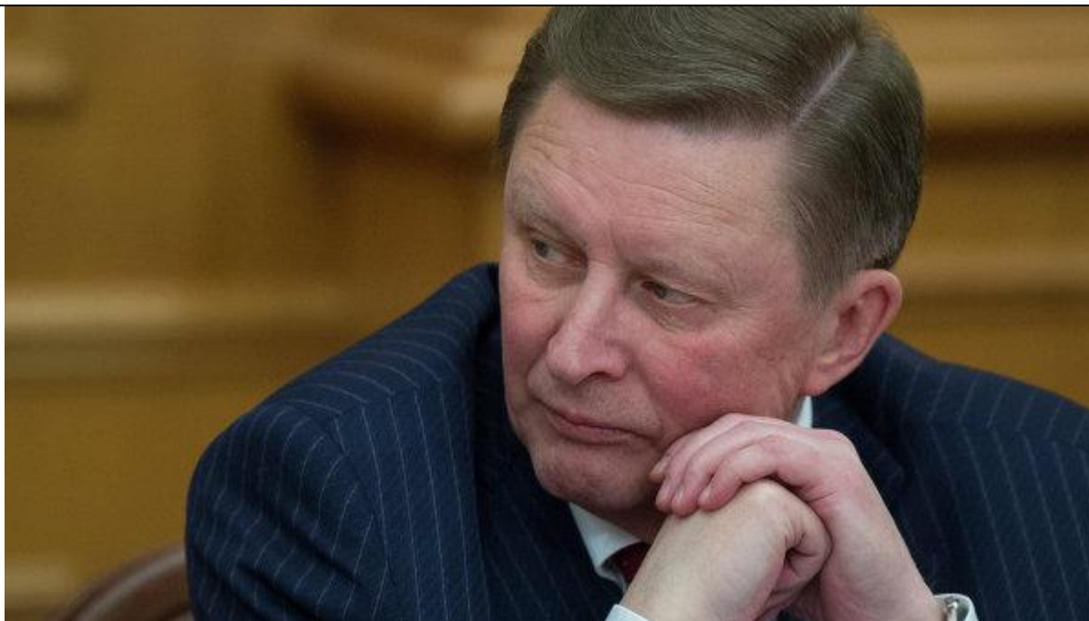
Руководитель администрации президента РФ Сергей Иванов. Архивное фото

http://ria.ru/society/20150619/1078543788.html