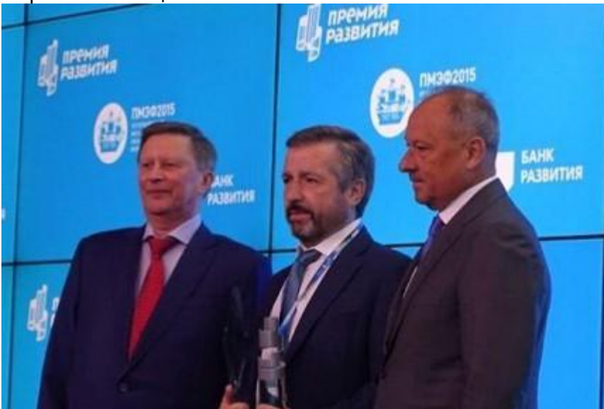
УТЗ наградили за лучший экспортный проект

Реализованный в Монголии. 19 июня 2015 года в рамках Петербургского международного экономического форума состоялась церемония вручения ежегодной "Премии развития". Она учреждена Внешэкономбанком и дается за реализацию национально значимых инвестпроектов. ЗАО "Уральский турбинный завод" (холдинг РОТЕК) стало победителем в номинации "Лучший экспортный проект" - предприятие отметили за строительство для Улан-Баторской ТЭЦ-4 нового энергоблока мощностью 123 МВт.