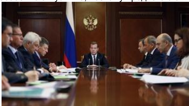
Совещание о докапитализации Внешэкономбанка

В общем надо признать, что участие банка в реализации такого рода проектов, безусловно, было необходимым и оправданным. До последнего времени банк справлялся с привлечением ресурсов на международных рынках для финансирования инвестпроектов. Сейчас, как известно, условия изменились, наши партнеры не только не участвуют в такого рода проектах, но и ограничивают деятельность ряда банков. Тем не менее Внешэкономбанк остается качественным заемщиком и эффективным кредитором, свои обязательства исполняет. Нам нужно, чтобы банк сохранил необходимые объемы поддержки национальной экономики в нынешних условиях, когда экономическая политика страны опирается прежде всего на внутренние источники финансирования, на такие подходы, которые должны нам позволить создавать наши современные и качественные продукты, на поддержку промышленного экспорта. Это все сейчас особенно актуально, поэтому предлагаю эти вопросы сегодня обсудить на совещании.