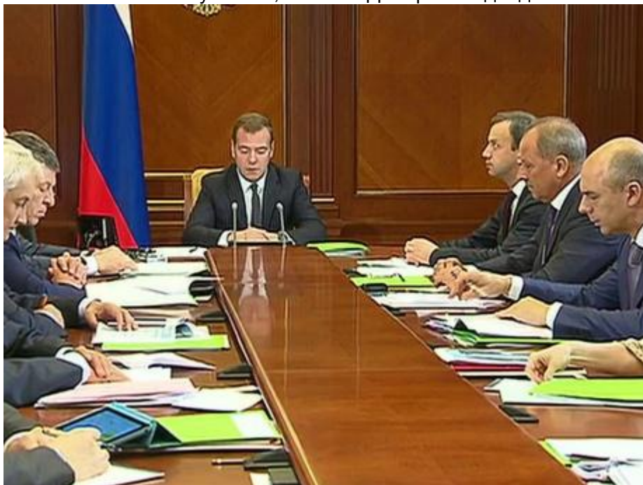
В правительстве обсудили меры поддержки "Внешэкономбанка"

"Нам нужно, чтобы банк сохранил необходимые объемы поддержки национальной экономики в нынешних условиях, когда экономическая политика страны опирается, прежде всего, на внутренние источники финансирования, на такие подходы, которые должны нам позволить создавать наши современные качественные продукты, на поддержку промышленного экспорта, это все особенно актуально", - сказал Дмитрий Медведев.