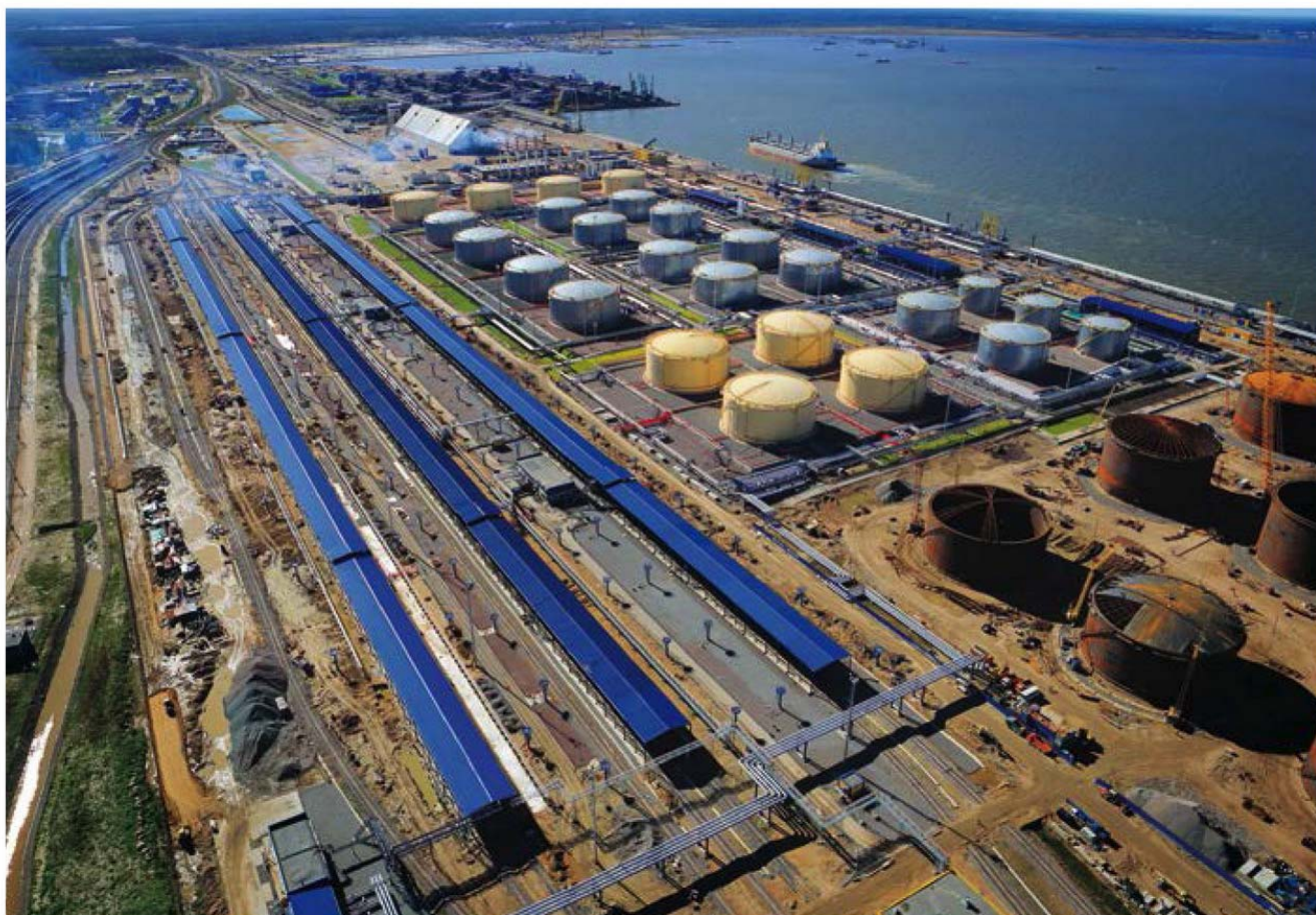
The oil products trans-shipment terminal at the marine trade port of Ust-Luga is one of the bank's largest infrastructure projects