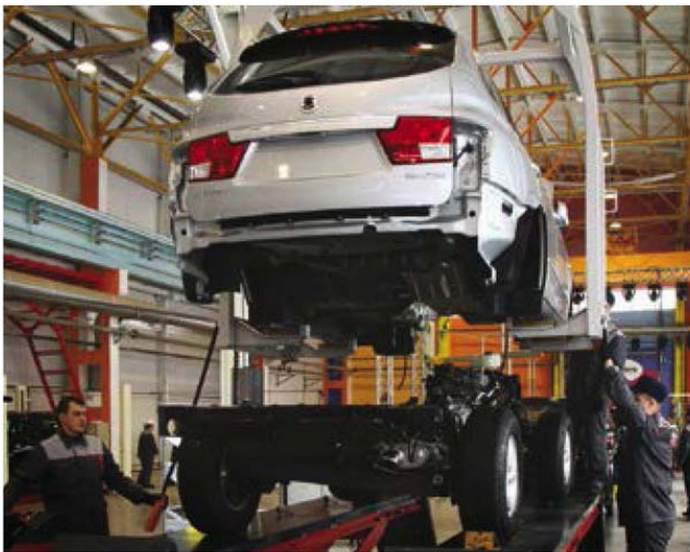
The first full-cycle automobile factory in Vladivostok

At the government's request, VEB also invested more than 241 billion rubles into financing 20 Olympic projects in Sochi.