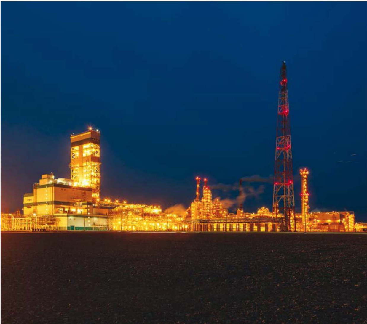
The Tobolsk-Polymer project is one of the largest investment projects in the Russian petrochemical sector supported by US$ 1.8 billion from VEB

Vnesheconombank (VEB) is a state corporation that functions as a development bank. It operates to diversify the Russian economy, to boost its competitive edge and to encourage the inflow of investment