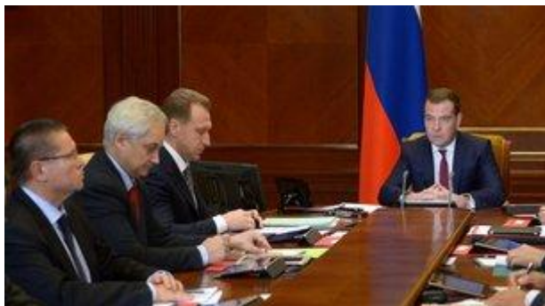
Заседание наблюдательного совета Внешэкономбанка

Вот ряд вопросов, которые мы рассмотрим, но есть и другие, естественно, как обычно. Давайте приступим к работе.