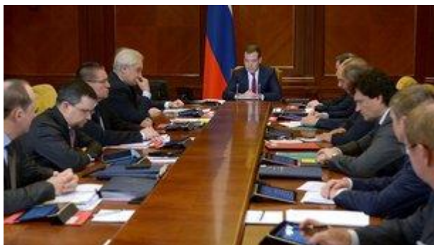
Заседание наблюдательного совета Внешэкономбанка