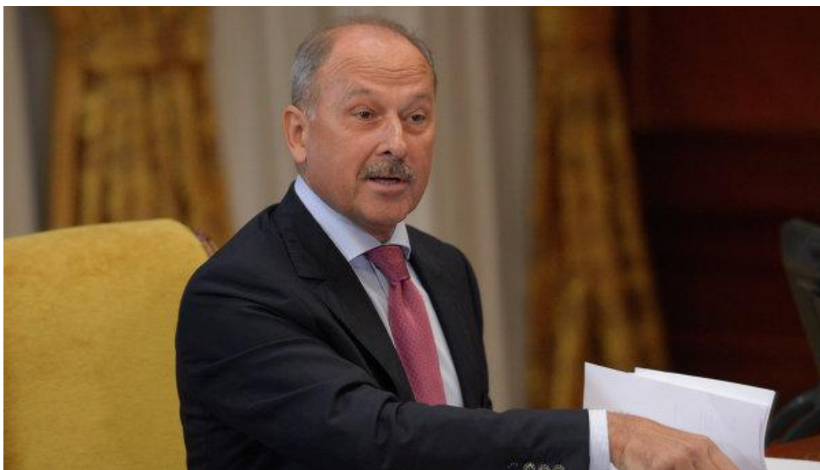
Глава Внешэкономбанка Владимир Дмитриев

Ранее СМИ сообщали, что в прошлом году ВЭБу пришлось докапитализировать Проминвестбанк на 365 миллионов долларов из-за создания резервов под проблемные кредиты, что критически давило на капитал. Теперь на эти же цели банку требуется еще 405 миллионов долларов.