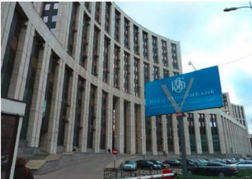
Die Mittelstandsbank MSP-Bank ist ein Tochterunternehmen der russischen Entwicklungsbank Wneschekonombank. Im Bild: Die Zentrale in Moskau

jekt zur Einführung innovativer Medizintechnik zur Früherkennung von Krebs und den Aufbau eines Netzwerks von diagnostischen Laboren in Moskauer Kliniken. Außerdem haben wir einen Produzenten von Glas und Glaskomposit-Werkstoffen bei der Einführung einer neuen vielversprechende Technologie unterstützt.