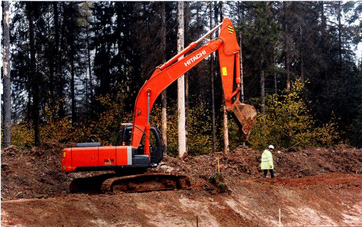
Банк поможет привлечь инвесторов для развития региональной дорожной сети

низма финансирования проектов, проходящих через Инвестфонд. Зачем из бюджета выделять средства на строительство инфраструктурного объекта, который будет использован частным инвестором когда-то в будущем? Ведь сейчас сначала выделяют бюджетные средства, проводят тендер и за счет бюджета строят дорогу и проводят ЛЭП к месту предполагаемого завода. А дальше неизвестность — придет частный инвестор или нет, нарушит он сроки строительства этого завода или выполнит их? Это нигде жестко не регламентируется. Да, есть инвестиционное соглашение, но оно не содержит в себе каких-либо норм для инвестора, заставляющих его придерживаться сроков, серьезных финансовых последствий для него не наступает. В любом случае у него уже есть дорога и ЛЭП. В этой связи мы предложили собственную концепцию финансирования комплексных проектов развития территории, предполагающую разделение проекта на две части, финансируемые за счет двух частных инвесторов — промышленного и инфраструктурного, графики строительства которых совмещены между собой. То есть первоначально проводится конкурс