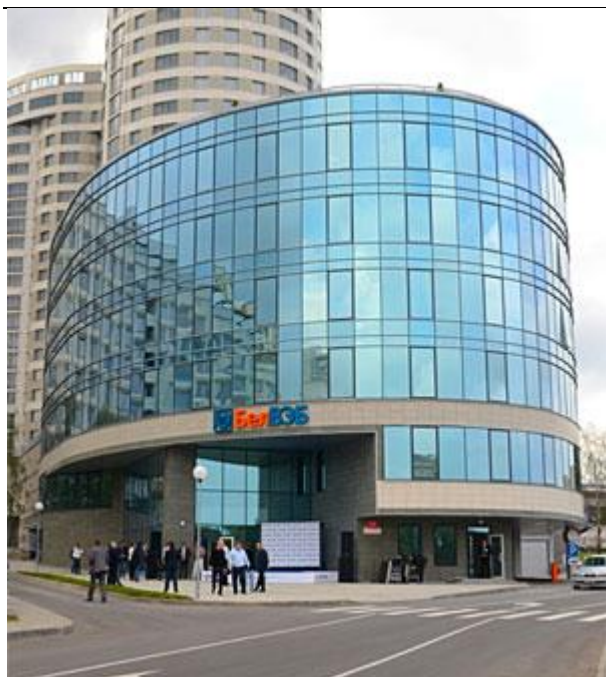
Новые стены для старой гвардии

http://www.respublika.info/5570/finance/article56241/