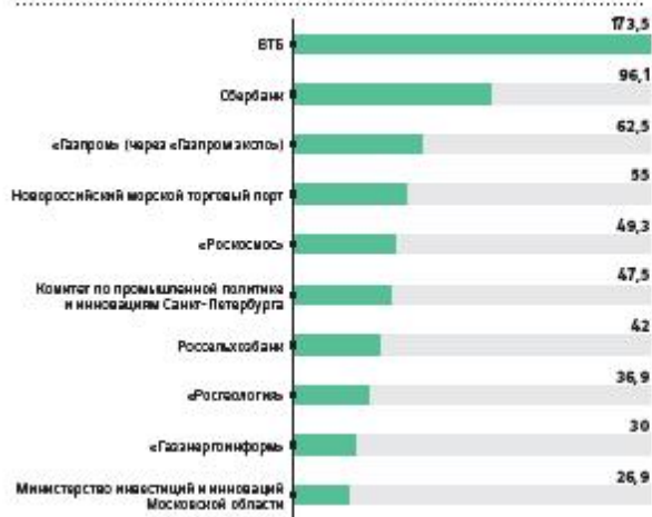
Кто больше всего потратил на ПМЭФ в 2016 году, млн руб.