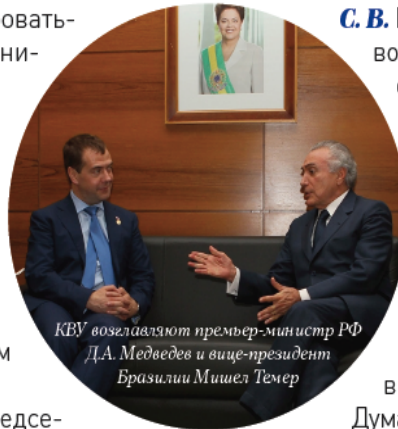
КВУ возглавляют премьер-министр РФ Д.А. Медведев и вице-президент Бразилии Мишел Темер