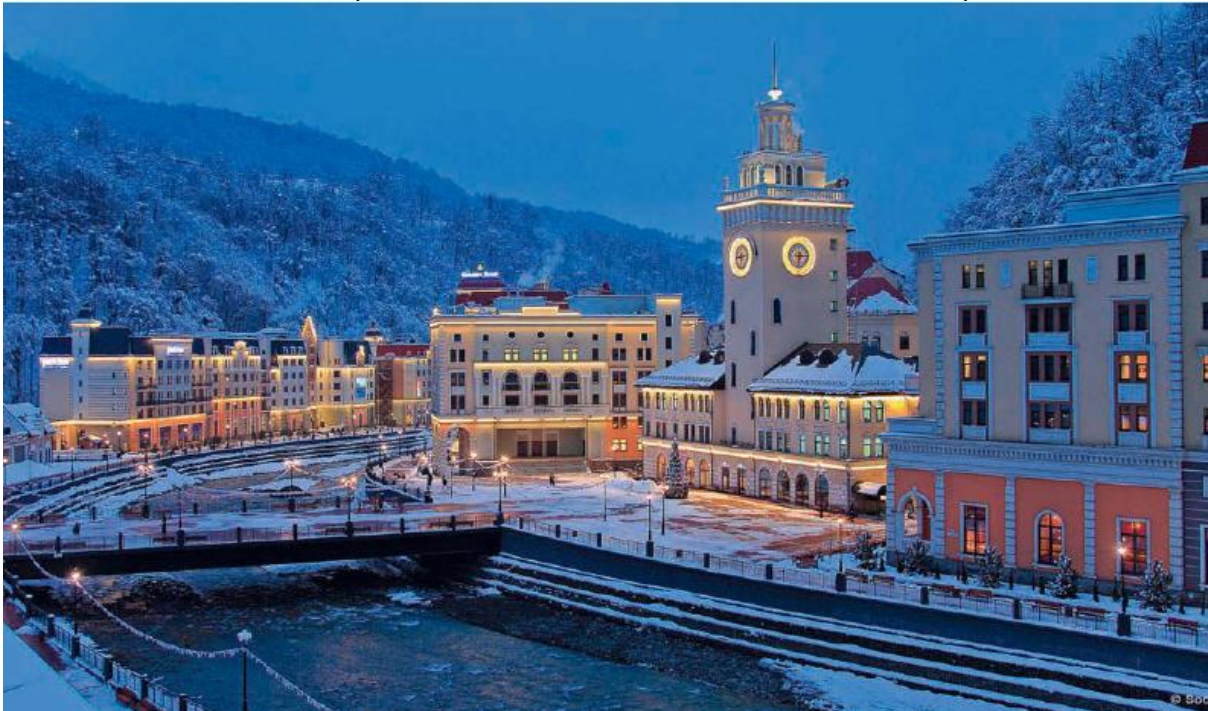
"Роза Хутор" задумывался как частный проект, а стал олимпийским.

33 медали завоевала сборная России на XXII зимних Олимпийских играх